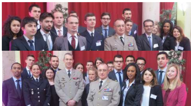
Présence lors de la matinée de restitutions du GCA Bernard de Courrèges d'Ustou

Les thèmes présentés portaient sur : les outils d'influence de la France à l'étranger, les interventions de la coalition internationale au Moyen-Orient, les outils législatifs et réglementaires en termes de renseignement.