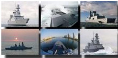
Frégates de défense aérienne type Horizon