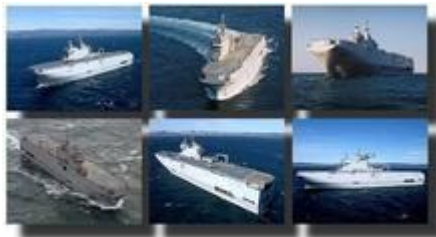
Le BPC Mistral