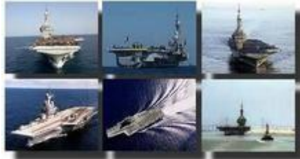
Le porte-avions Charles de Gaulle