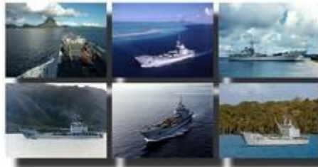
Bâtiments de transport léger