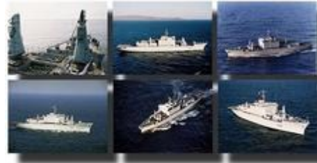
Bâtiment atelier polyvalent