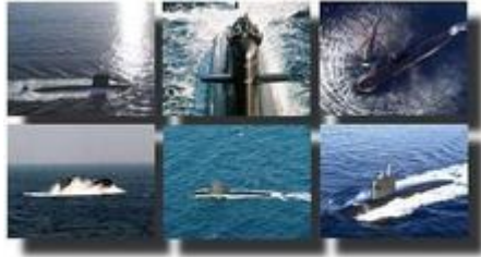
Les sous-marins nucléaires d'attaque