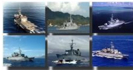
Frégates de surveillance