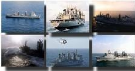
Bâtiment de commandement et de ravitaillement