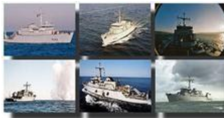
Chasseurs de mines tripartites