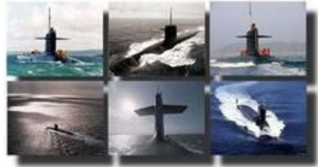
Les sous-marins lanceurs d'engins