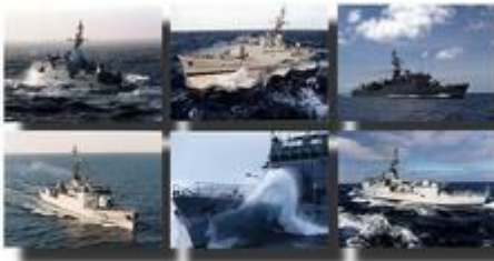
Avisos type A 69