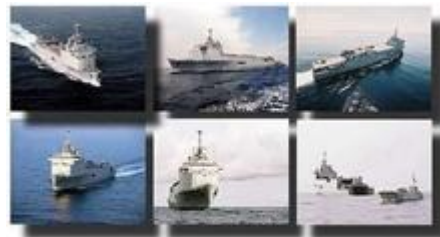
Transports de chalands et de débarquement