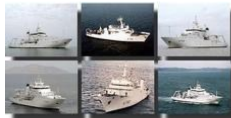
Bâtiment hydrographe et océanographe