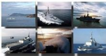
Frégates La Fayette