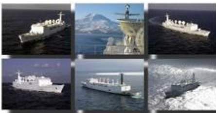
Bâtiment d'essais et de mesures