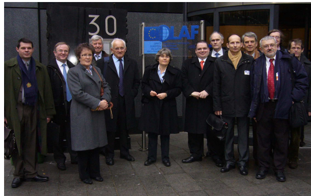
Voyage d'étude à Bruxelles d'une quinzaine d'auditeurs pour lancer le cycle sur les institutions européennes

Parlement du rôle d'instance de validation à celui d'une instance à réelle compétence budgétaire lui permet par ses votes de peser sur des choix politiques et lui donne plus de « pouvoir ». Par exemple, les députés ont obtenu des aménagements des textes sur les accords SWIFT, la taxe carbone, l'encadrement des « hedge-funds »... Si les Français se heurtent encore à la prédominance anglaise sur les décisions financières et allemandes sur les problèmes industriels, ils se font dorénavant mieux entendre.